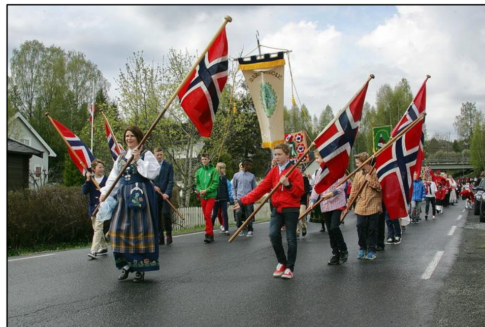
Skole- og folketog på Darbu, 17. mai 2013.

Folkemøte om kommunereformen, åpning av sykkelsti mellom Hakavik og Eidsfoss, i tillegg til Fiskum Skole- og Ungdomskorps 60-års jubileumskonsert